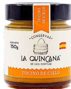
Tocino de cielo

Ingredientes: Azúcar de caña ecológica, HUEVO pasteurizado, agua y zumo de lima natural.