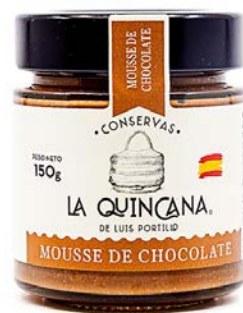
Mousse de chocolate

Ingredientes: Queso ( LECHE ), LECHE pasteurizada, NATA pasteurizada ( LECHE ), azúcar de caña ecológica, grasa vegetal totalmente hidrogenada (palmiste), cacao, harina de trigo ( GLUTEN ), HUEVO pasteurizado, glucosa, sal, aromatizantes, estabilizantes (E-322, E-407, E-476), gasificantes (E-500ii, E-503i y E-503ii) y conservador E-200. Puede contener trazas de SOJA y FRUTO CÁSCARA .