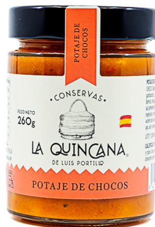
Potaje de chocos

Ingredientes: Agua, CHOCO ( Sepia officinalis ) (MOLUSCO) (19%), garbanzos, cebolla, zanahoria, morcilla y chorizo ibérico (magro, grasa y sangre de cerdo ibérico, sal pimentón dextrina, dextrosa, azúcar, ajo, especias y antioxidante E-301), panceta ibérica, aceite de oliva virgen extra, almidón de maíz, ajo, sal y especias.