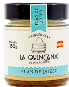
Flan de queso

El FLAN DE QUESO incorpora el aporte lácteo del queso para ofrecer una versión más rica y matizada. Su perfil destaca por un equilibrio entre dulzor y ligera acidez, con un final redondeado.