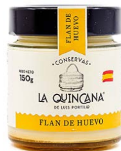
Flan de huevo

El FLAN DE HUEVO constituye un referente histórico de la repostería europea, elaborado a partir de ingredientes esenciales. Su estructura compacta se ve realzada por un ligero toque cítrico que aporta luminosidad al conjunto.