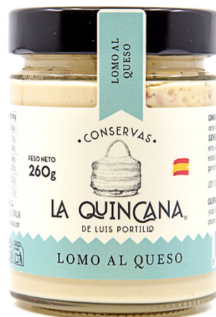
Lomo al queso

Ingredientes: Lomo de cerdo (46%), NATA (LECHE), QUESO (8%) (LECHE), agua, cebolla, aceite de oliva virgen extra (1%), almidón de maíz, ajo y sal.